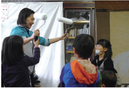
↑インターンシップ活動中の様子