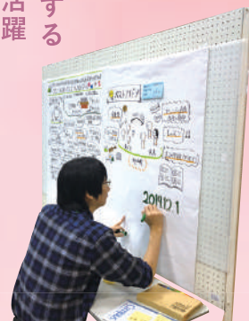
見ているだけで楽しい グラレコの模造紙は サポセンに掲示中！

ワークショップや講演会で話した内容をリアルタイムで絵や文字にまとめていく「グラフィックレコーディング(略してグラレコ)」が最近話題になっていますが、今回8名の方に協力していただいて導入しました。参加者からも「なんだか自分たちが話していることが凄いいことに感じてわくわくする！」と好評でした。