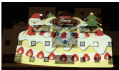
プロジェクションマッピングの様子

例えば、昨年11月に鎌ヶ谷市で行われた「新鎌イルミ」というイベントでは、この制度を活用した企画を行いました。これは当初は学生ボランティアの連携として大学へ相談があったのですが、色々話していくうちに「プロジェクションマッピングを制作できるゼミがあるので、オリジナルの作品を作るプロジェクトとして応募したら面白いかも」という話になり、今回の企画となったそうです。