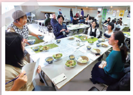
もう食べきれないくらい！と大満足の皆さん。