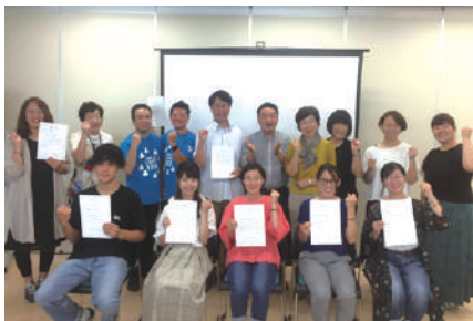
↑インターンシップ修了式の様子

「助成部門」では、県内で多様な状況にある子ども・若者の支援に取り組みNPOに対して、活動費を直接助成します。(注3)