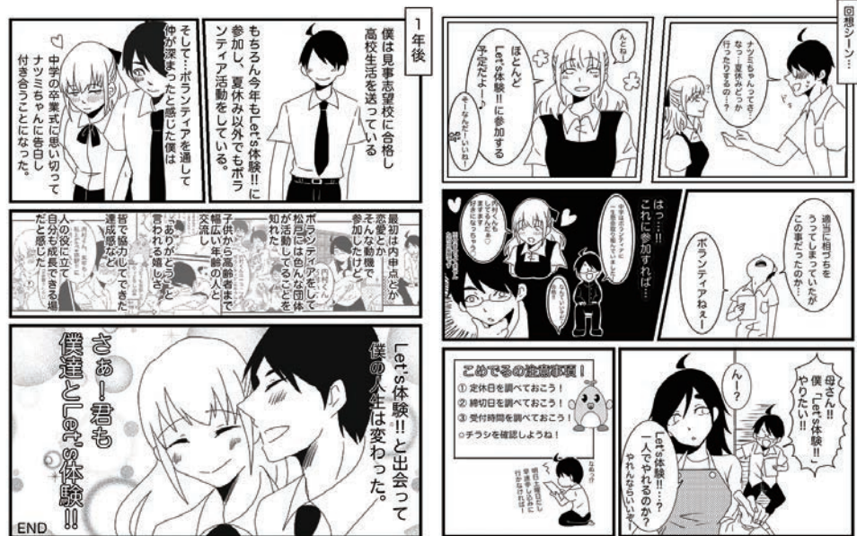
↑主人公がボランティアを通してどう成長していくのか...を表現するのに悩みました!! ボランティアで真面目に8Pも漫画を描くなんて初めてでした(笑)。

今回は中学生の頃から5年間、 イラストを担当している 「うっちー」の 漫画ページを一部ご紹介!